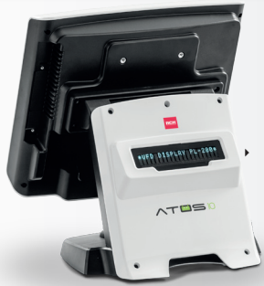
DISPLAY CLIENTE INTEGRATO